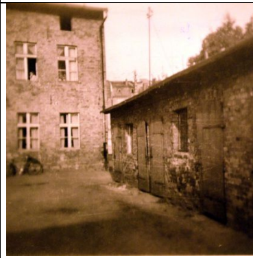
Schneidemühl: Hof Gartenstr. 37 (früher 8)