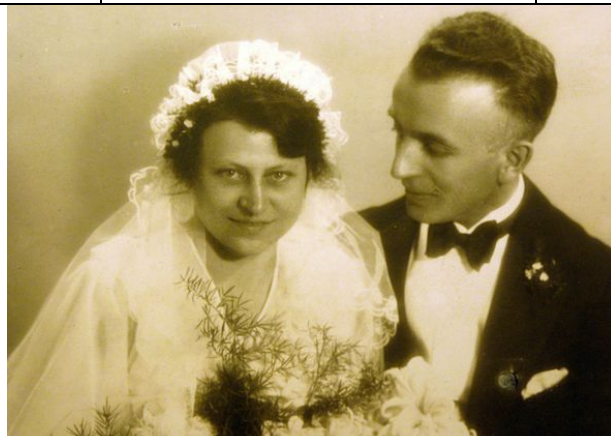
Hochzeit 1936 in Schneidemühl