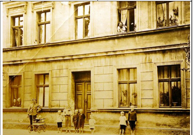
Schneidemühl: Gartenstr. 37 (früher 8)