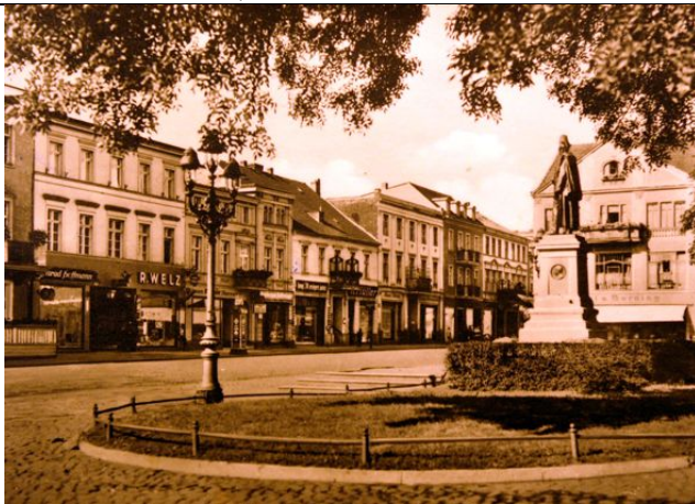
Schneidemühl: Am Neuen Markt