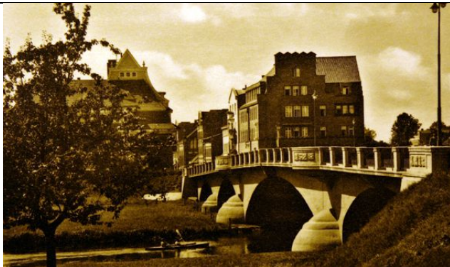
Schneidemühl: Karl Krause Brücke